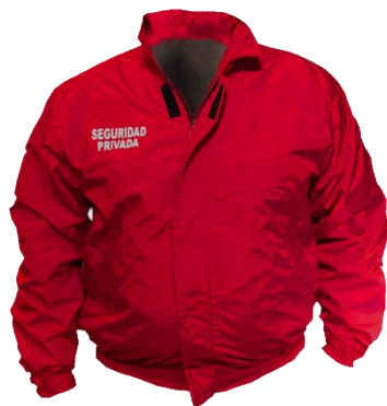
CORTAVIENTOS GUARDIA D867

Casaca guardia seguridad. Impermeable en interior acolchado. Conforme a Decreto 867. Prenda apta para bordar. Cintura y puños elasticados.