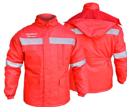
PARKA DE GUARDIA ROJO

Cortavientos Guardias de Seguridad, cumple con Decreto 867. Orientada a guardias de seguridad y personal de conserjerías, con credencial OS10. Prenda apta para bordar. Cintura elasticada.