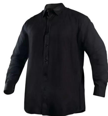
CAMISA OXFORD NEGRA

Descripción: Camisa confeccionada en tela oxford, permitiendo más comodidad y durabilidad en el tiempo, gracias a su tipo de tejido y tela más gruesa.