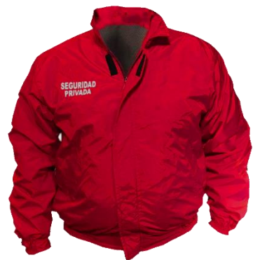
CASACA GUARDIA D687

Casaca guardia seguridad. Impermeable en interior acolchado. Conforme a Decreto 867. Prenda apta para bordar. Cintura y puños elasticados.