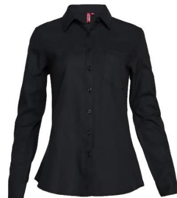
BLUSA OXFORD NEGRA

Descripción: Camisa confeccionada en tela oxford, permitiendo más comodidad y durabilidad en el tiempo, gracias a su tipo de tejido y tela más gruesa.